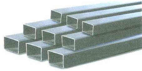
2. เหล็กกล่อง