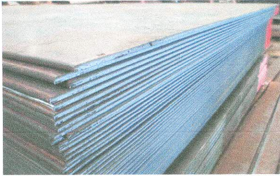
1. เหล็กแผ่น