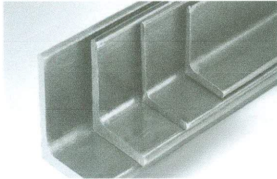
3. เหล็กฉาก